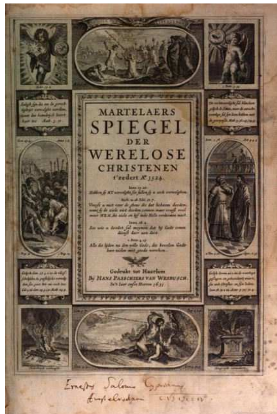
Titelblad van de 'Martelaers Spiegel'